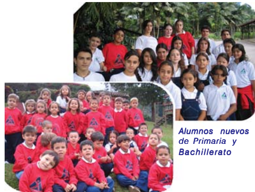
Alumnos nuevos de Preescolar

Les damos la bienvenida a los niños y jóvenes que ingresaron este año a La Colina. Esperamos que su vida en el Colegio esté llena de alegría y de excelentes resultados académicos. A sus familias, les damos las gracias por depositar su confianza en nuestro equipo de educadores.