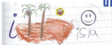
Ilustraciones: Valeria Zuluaga kinder A

Leer y escribir son procesos que van de la mano. Motive a los niños para que disfruten escribiendo. Acompáñelos en esta aventura que les permitirá aprender a expresar de una nueva forma, sus sentimientos y pensamientos.