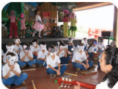
Juguemos a leer, narrando y cantando...