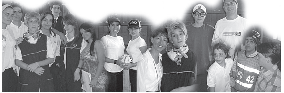
Los estudiantes emularon a sus profesores de una manera creativa, respetuosa y muy, muy divertida.

El viernes 13 de mayo los estudiantes le rindieron un homenaje de gratitud a sus maestros. Nuestros niños y jóvenes resaltaron el valor más representativo de cada docente, y con ello, reconocieron cuánto han aprendido de cada uno, cuántas virtudes implícitas en su gestión, cuánto cariño en su actuación diaria,