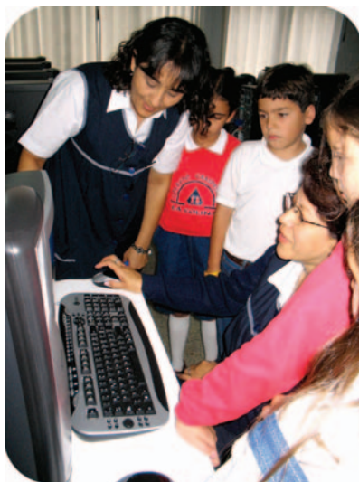
Aprendemos juntos cada día, para enseñar a aprender.