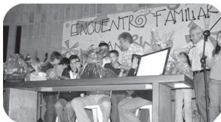
Nuestran gran familia reunida

¡El lleno fue total! Estamos felices y muy agradecidos con los Padres de Familia que con su nutrida asistencia y generosa colaboración hicieron posible tan exitoso evento. Queremos resaltar muy especialmente: la unión e integración familiar y la significativa colaboración de los estudiantes de los grados Sexto, Noveno y Décimo y de nuestros docentes.