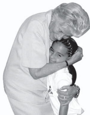
Miss Duque también nos acompañó en el Día del Abuelo