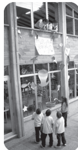
La pesca milagrosa, uno de los divertidos eventos del bazar

Ese viernes 10 de julio gozamos de la asistencia de todos los padres y amigos de los niños. Entre las atracciones hubo pesca milagrosa, barco inflable, globo con balones, casa embrujada, mini-TK y San Andresito. Nuestro más sincero agradecimiento a los padres por sus donaciones a las ventas y nutrida asistencia, y a los profesores, pues sin su colaboración no hubiera sido posible la organización que hubo ese día.