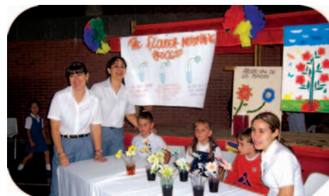
Los niños de primero dejando en alto el nombre del Colegio

El 9 de septiembre, en el Colegio San José de las Vegas, se llevó a cabo la segunda jornada de "Pequeños Científicos en Acción". Nosotros participamos por primera vez con un grupo de alumnos de Primero, quienes causaron un gran impacto por la calidad, innovación y seguridad de su exposición, que fue en español y en inglés. El tema elegido fue "the flower absorbing process".